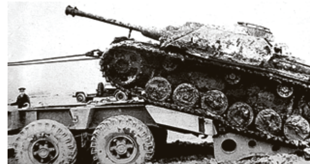
■ Вытащив из земли, самоходку погрузили на тягач МАЗ-537 и доставили в Калининград, в Первомайский городок

что если бы трактористы крышу капонира не распахивали, то она вообще была бы сухой. А так нарушили плугами гидроизоляцию, в нее и натекло.